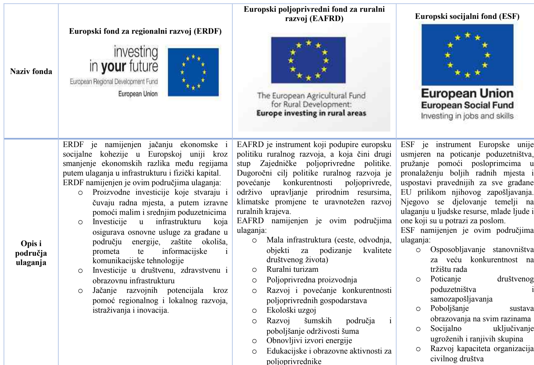
Tablica 27 Najznačajniji europski fondovi