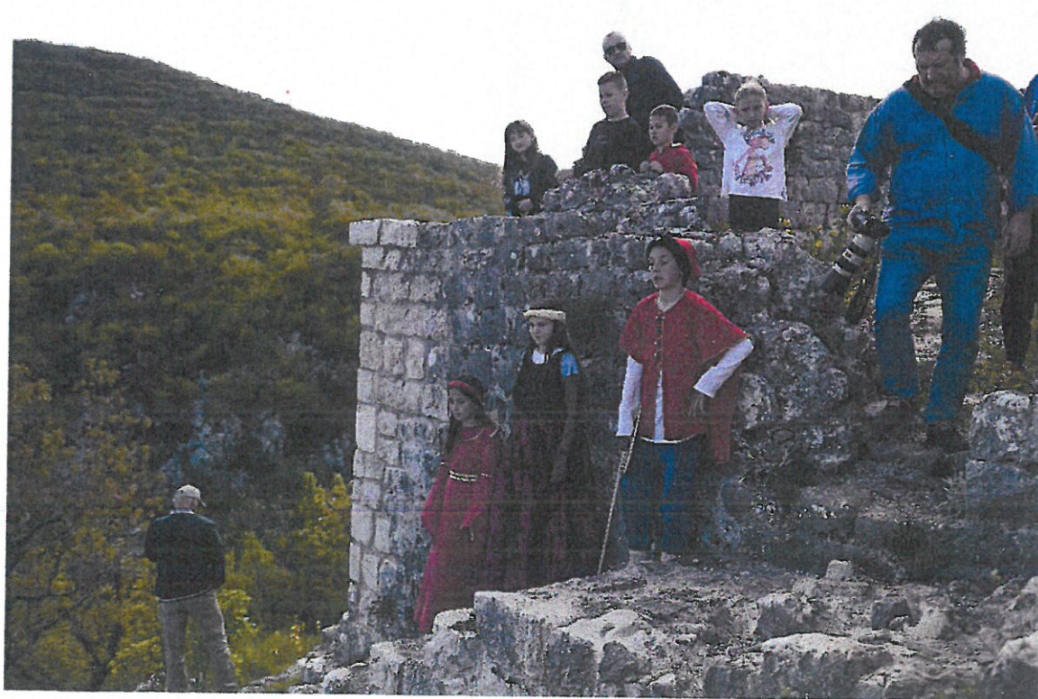
9. Manifestacija Noć tvrđava na Nutjaku