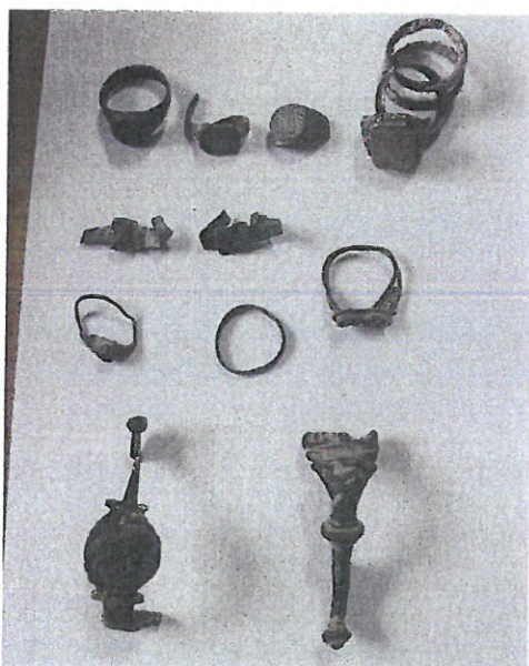
2. Dio predmeta otkupljenih za Arheološku zbirku