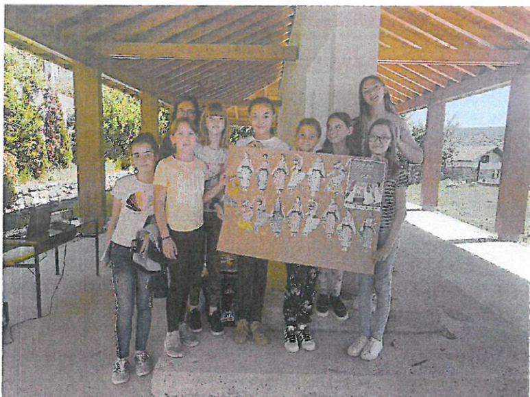
7. Sudionici 27. EMA-e iz OŠ Trilj