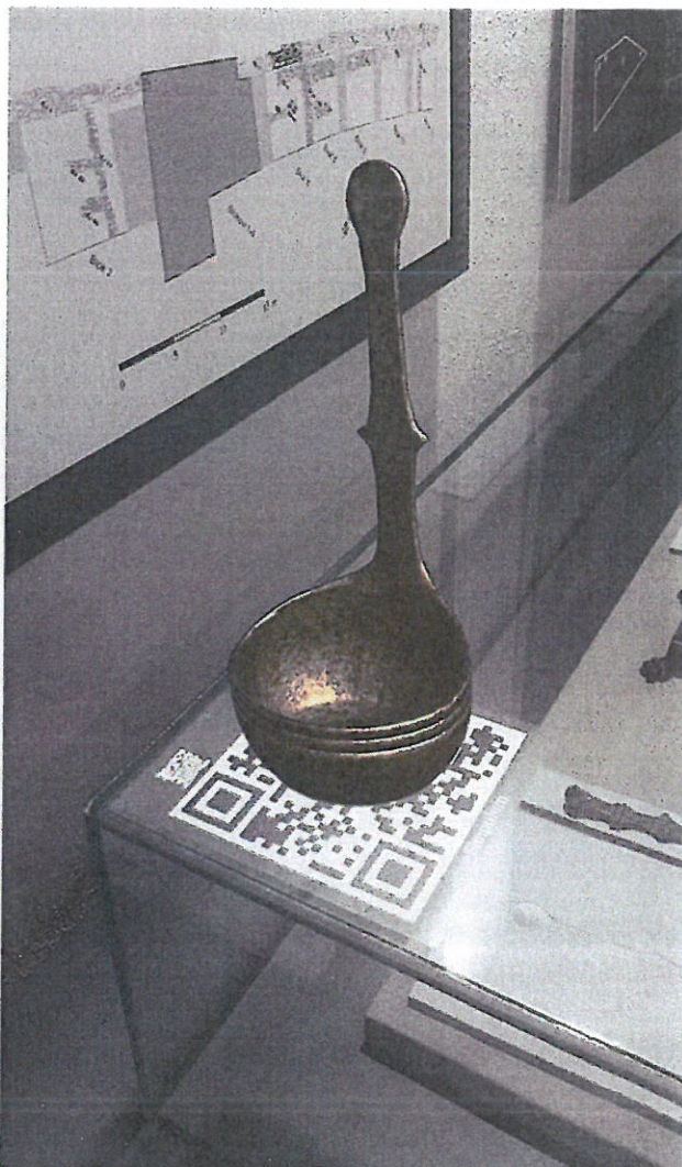
4. 3D model simpuluma

Trajna izložba Etnografska baština Trilja i stare fotografije prezentira predmete iz Etnografske zbirke te izbor fotografija datiranih na polovinu 20. st. koje dočaravaju materijalnu i nematerijalnu kulturu i baštinu triljskog kraja.