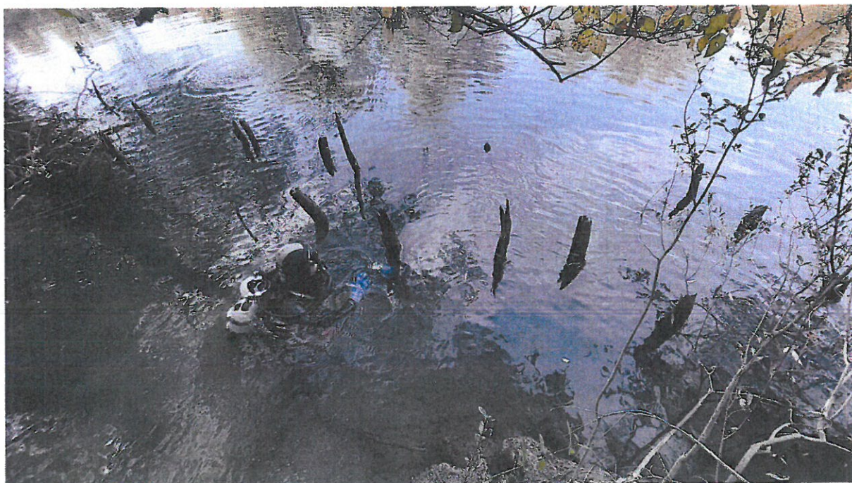
11. Podvodno rekognosciranje ICUA Zadar

U listopadu 2022. godine izvršeno je podvodno rekognosciranje dijela korita rijeka Cetine i Rude s ciljem ubiciranja sojeničkih naselja. Rekognosciranje su izvršili stručnjaci iz Međunarodnog centra za podvodnu arheologiju u Zadru.