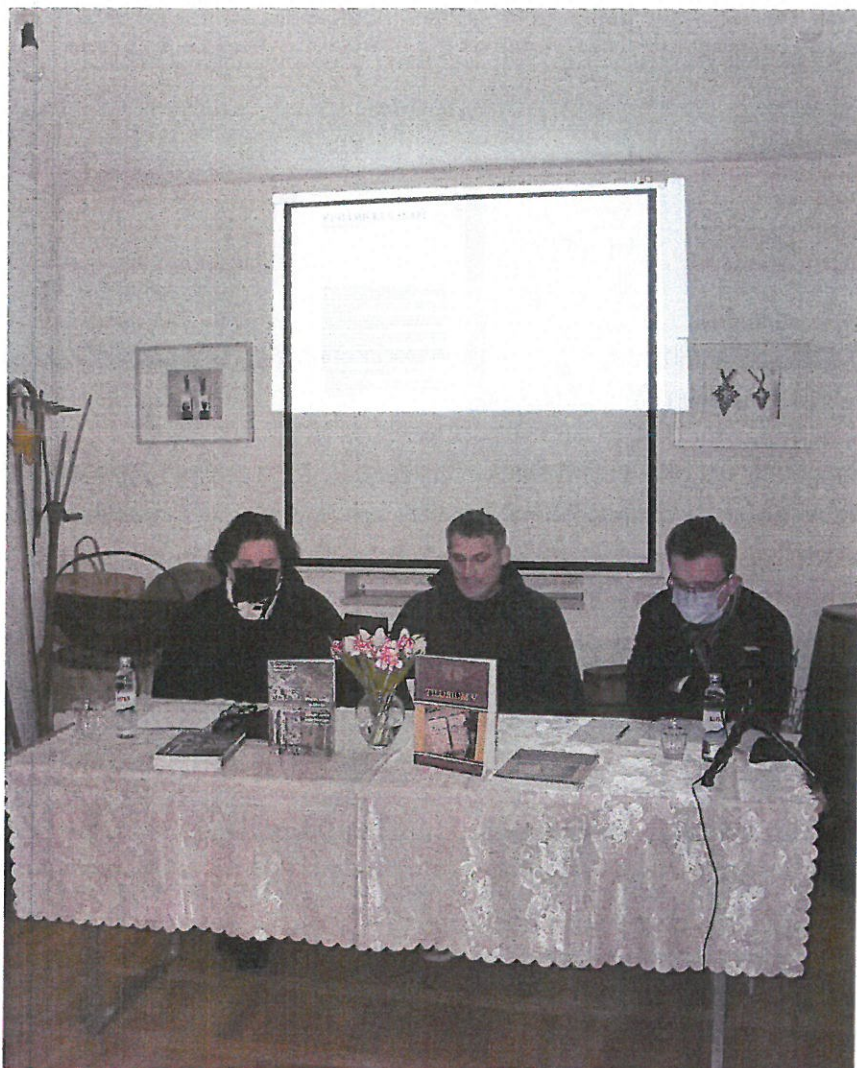
10. Noć muzeja – predstavljanje publikacija

Noć muzeja, 28. 01. 2022. - 17. Noć muzeja s temom „Muzeji između stvarnog i digitalnog“ ugostila je djelatnike Odsjeka za arheologiju FF Sveučilišta u Zagrebu. Organiziran je prijenos uživo predstavljanja publikacija Tilurium V. i Rimski spolji iz Tilurija. Vodič po triljskom kraju na Youtube kanalu muzeja.