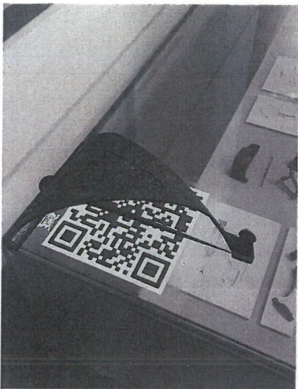
3. 3D model fibule

Trajna izložba Tilurium - rimski vojni logor postavljena je u rujnu 2009. godine, a prvotno je bilo izloženo ukupno 300 eksponata izabranih između nalaza iz prvih deset godina istraživanja rimskog legijskog logora Tilurij na Gradunu. Izborom nalaza proizišlih iz recentnijih arheoloških istraživanja istog lokaliteta, izložba je upotpunjena s novim predmetima. Uz muzejske predmete izložena su i muzeografska pomagala; karte, crteži, rekonstrukcije i druge vizualizacije. U 2022. godini je u stalno postav dodano sedam 3D modela muzejskih predmeta rekonstruiranih u tehnologiji potpomognute stvarnosti iz tehničkih crteža.