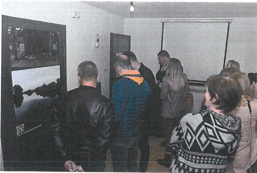
6. Otvorenje izložbe Arheološko blago Cetine