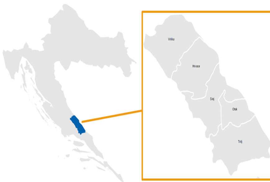
Slika 2: Karta položaja LAG-a na karti Republike Hrvatske