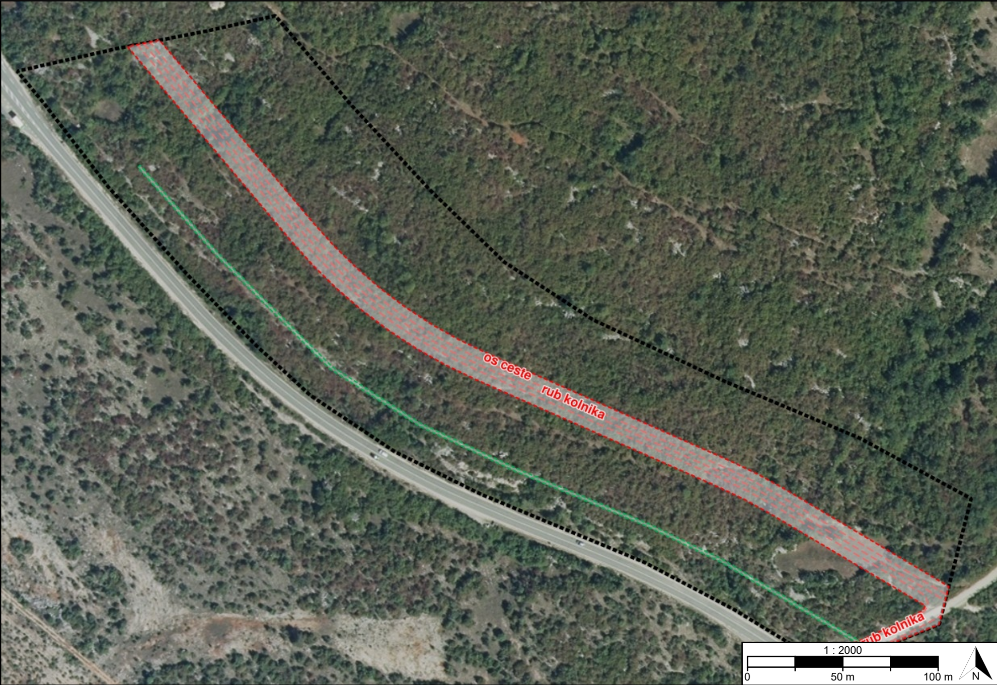
Postupak izrade i donošenja prostornog plana Urbanistički plan uređenja stambene zone "Ugljane"